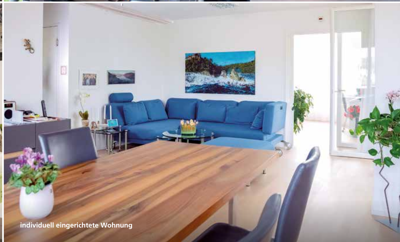
individuell eingerichtete Wohnung