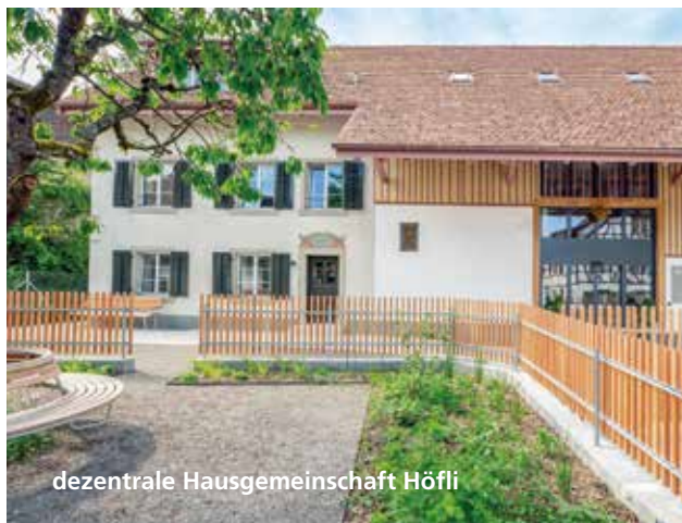
dezentrale Hausgemeinschaft Höfli

«In allen Hausgemeinschaften erleben wir den Alltag zusammen.»