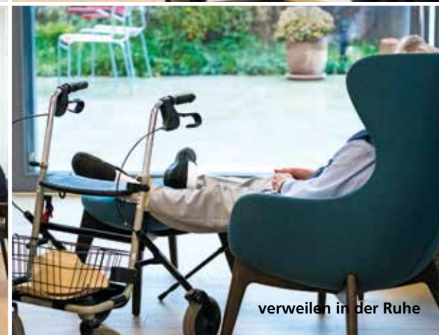
verweilen in der Ruhe