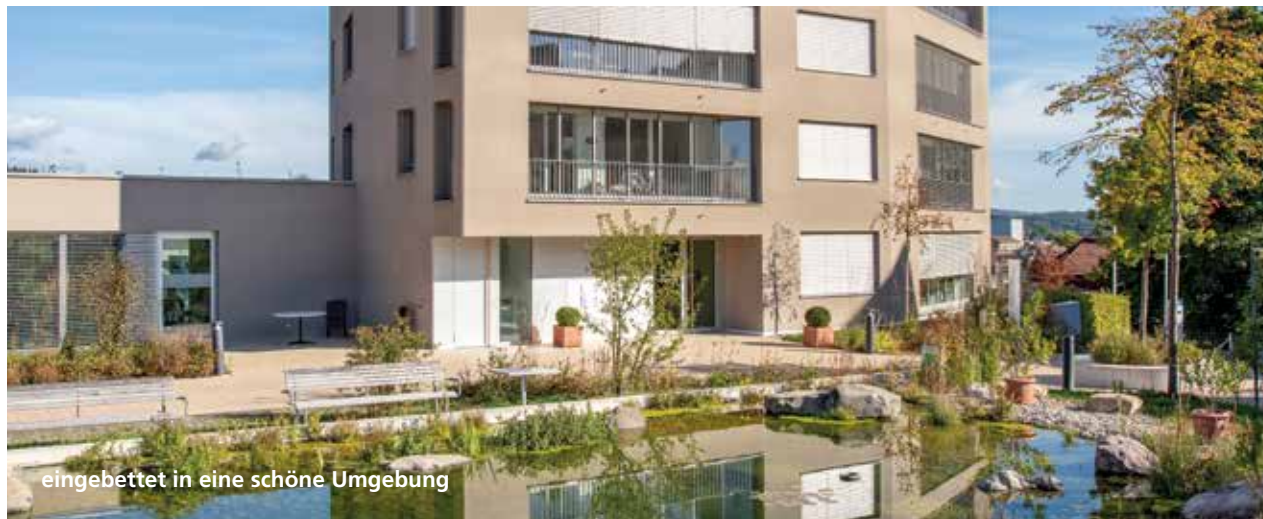
eingebettet in eine schöne Umgebung

Sich sicher zu fühlen und Sicherheit zu haben, ist für ältere Menschen sehr wichtig. Diese gewährleisten wir durch ein 24-h-Notrufsystem, mit dem alle Wohnungen ausgestattet sind.