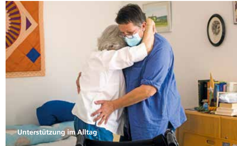
Unterstützung im Alltag

«Das Miteinander macht den Alltag abwechslungsreich und bringt Freude.»