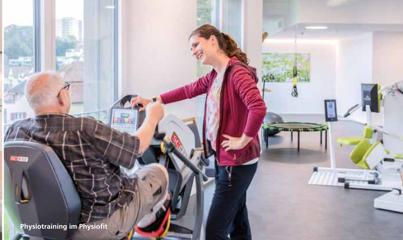
Physiotraining im Physiofit