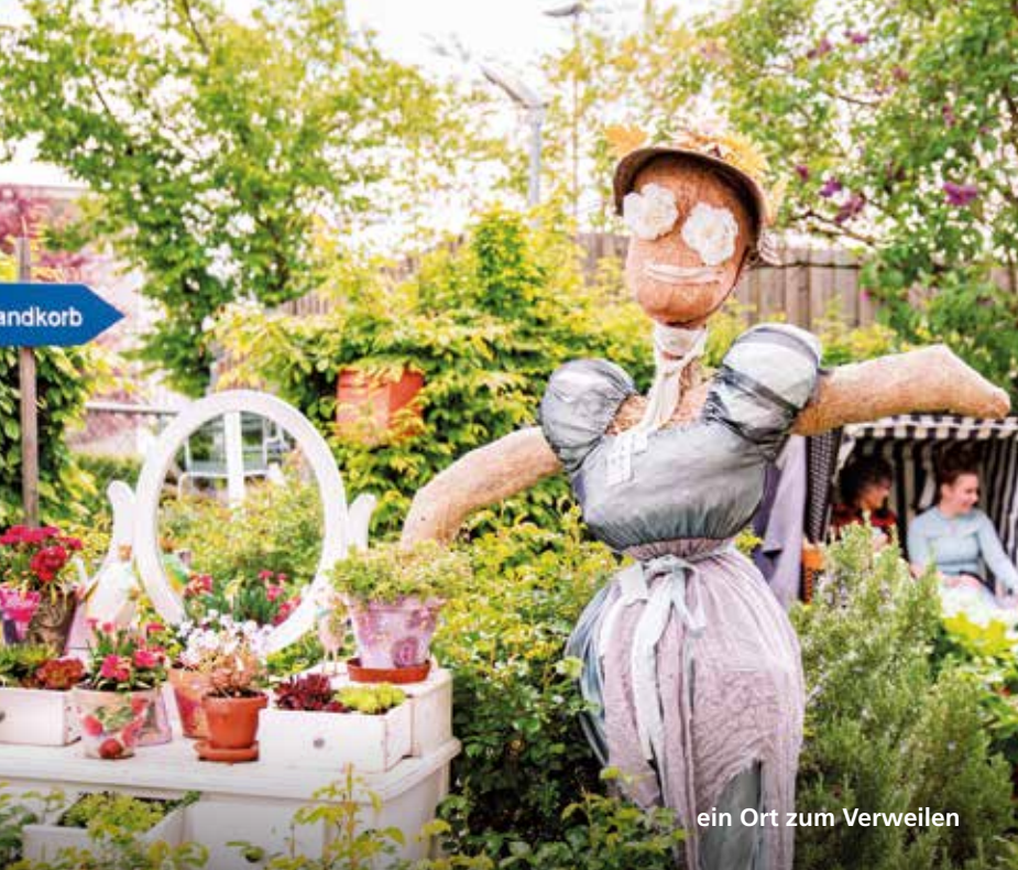
ein Ort zum Verweilen