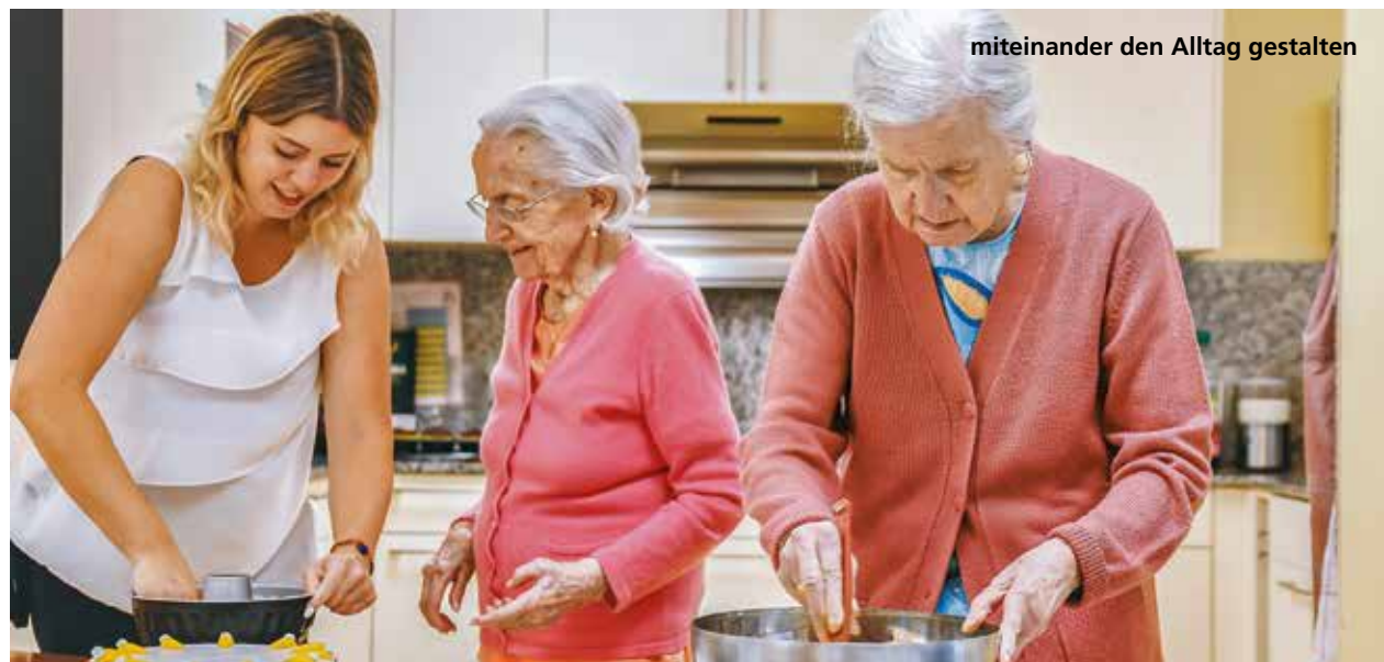
miteinander den Alltag gestalten

«Die Bedürfnisse der Person mit Demenz mit ihrer eigenen Lebensgeschichte sind die Basis für eine individuelle Gestaltung der Zusammenarbeit.»