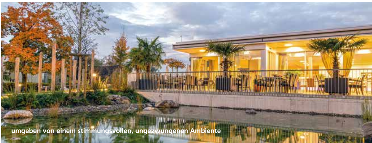
umgeben von einem stimmungsvollen, ungezwungenen Ambiente

Tel. 052 630 32 50 oder gastro@schoenbuehl-sh.ch