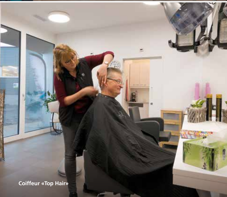
Coiffeur «Top Hair»