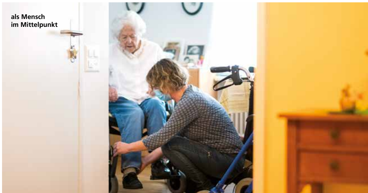
als Mensch im Mittelpunkt

Wohlbefinden und ein erfülltes, selbstbestimmtes Leben auch im hohen Alter mit Pflegebedarf sind wesentlich. Wertschätzung, Privatsphäre und hoher Wohnkomfort – die angenehme Umgebung und die neu gewonnene Sicherheit machen das Leben im Schönbühl lebenswert. Hier leben wir unseren Alltag in einem partnerschaftlichen Miteinander.