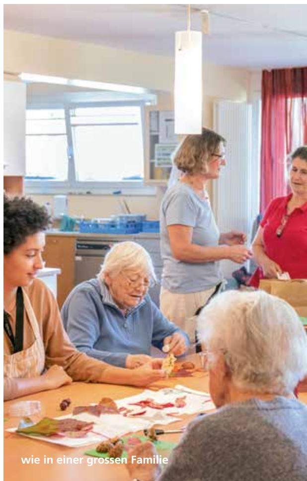
wie in einer grossen Familie

Die beiden Hausgemeinschaften Niklausen 1 und 2 befinden sich auf dem Areal des Kompetenzzentrums Schönbühl. Zur Wohnumgebung zählen die persönlichen Zimmer der Bewohnenden, ein Wohnzimmer mit Wintergarten, eine modern ausgestattete Wohnküche und ein geschützter Garten. Ihre Zimmer können die Bewohnerinnen und Bewohner mit persönlichem Mobiliar einrichten, denn Erinnerungen an die eigene Vergangenheit sind für sie ganz besonders wichtig.