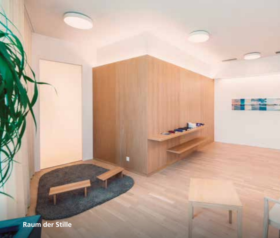
Raum der Stille