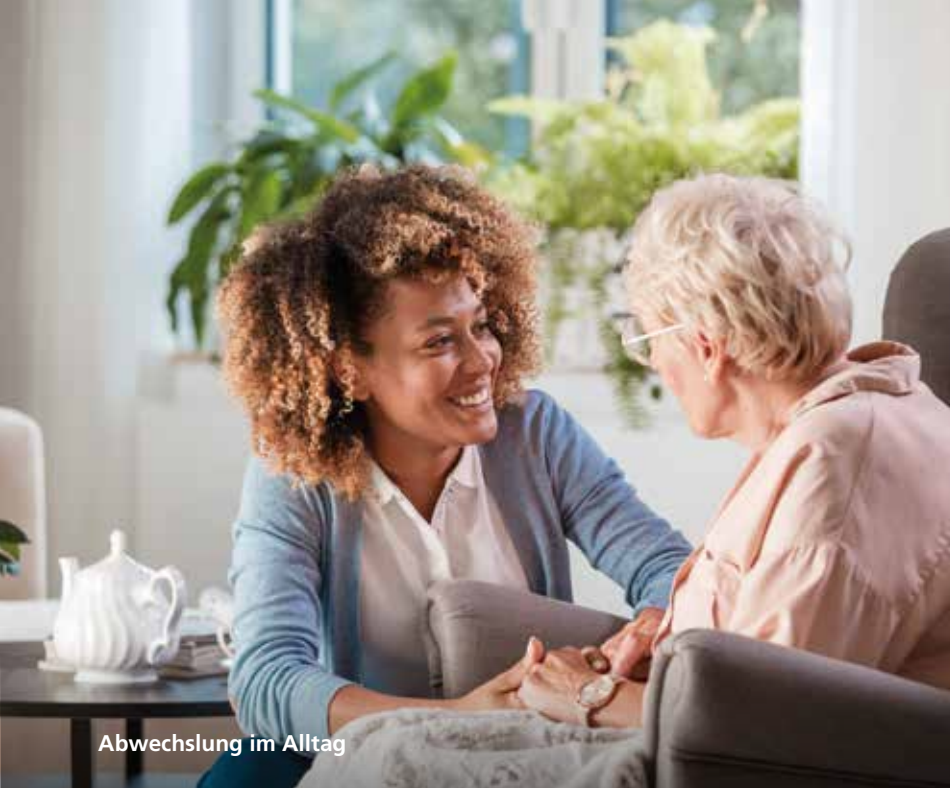
Abwechslung im Alltag