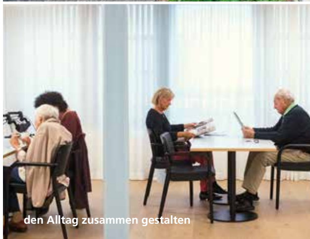
den Alltag zusammen gestalten