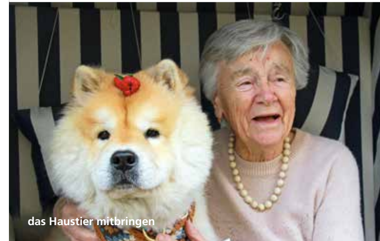
das Haustier mitbringen